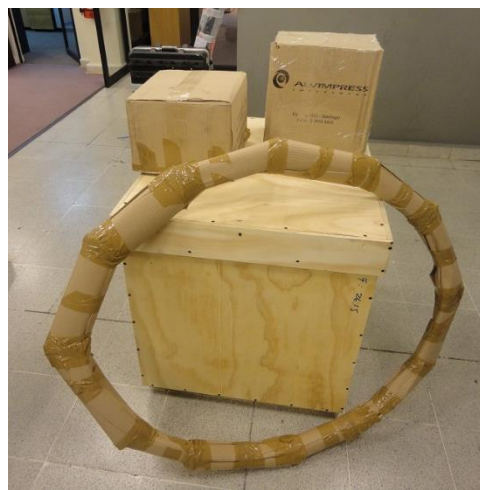
Figura 1: Ejemplo de embalaje de TNT.

b.4) DIRAC no ofrece embalaje especializado. En caso de ser requerido por el proyecto, el postulante deberá realizar una cotización con una empresa externa y costearlo con recursos propios (ver página http://www.sag.cl/ambitos-de-accion/embalajes-de-madera-de-importacion ).