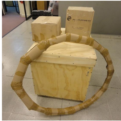
Figura 1: Ejemplo de embalaje de TNT.

b.4) DIRAC no ofrece embalaje especializado. En caso de ser requerido por el proyecto, el postulante deberá realizar una cotización con una empresa externa y costearlo con recursos propios (ver página http://www.sag.cl/ambitos-de-accion/embalajes-de-madera-de-importacion ).